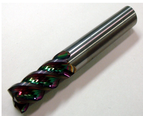
cBN コーティング工具

摩擦係数が非常に小さく、ダイヤモンドに次ぐ硬さを持つcBN（cubic Boron Nitride）をコーティングした工具の開発を行っている。切削油を使用しないドライ加工の実現により、環境負荷低減を目指す。